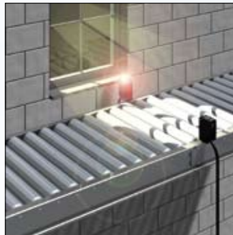
Высокая устойчивость к интенсивному внешнему освещению