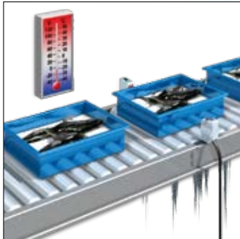
Жесткие условия эксплуатации