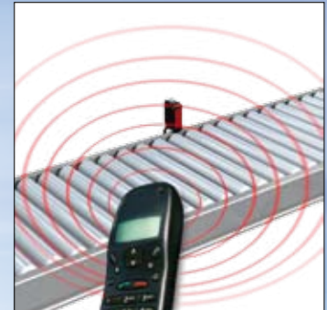
Устойчивость к электромагнитным помехам