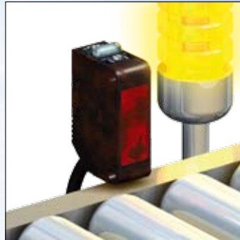
Контроль состояния датчика